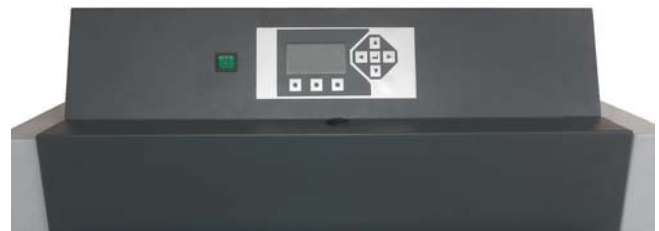
Einfacher geht es nicht - das Bedienfeld des BRUNS Holzvergaserkessels.