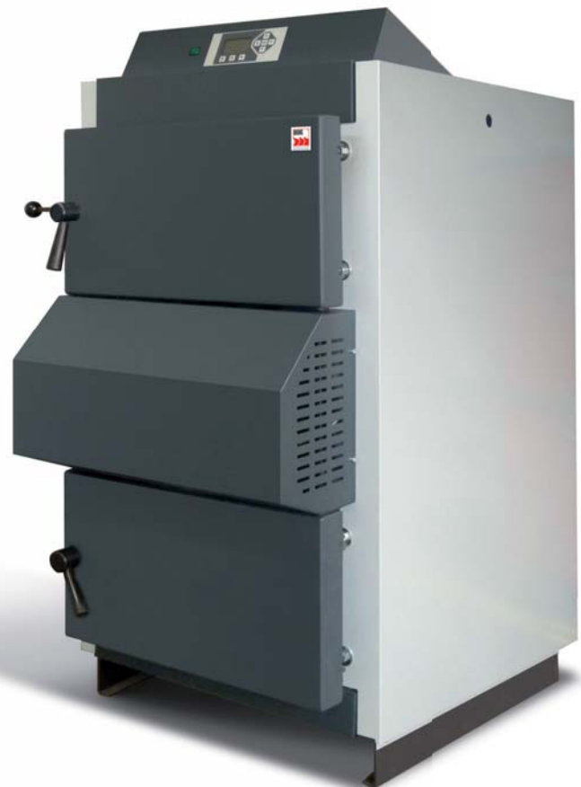
Abb. BRUNS Holzvergaserkessel BHV-30

Schon gewusst? BRUNS Heiztechnik ist ein mittelständisches Unternehmen mit über 130 Mitarbeitern und seit über 60 Jahren in der Heizungsbranche tätig. Keine Massenprodukte, vielmehr individuelle, maßgeschneiderte Wärmeerzeuger und Speicher für Solarkreisläufe, sowie Units für Systemanbieter kompletter Heizungsanlagen gestalten die Produktpalette der